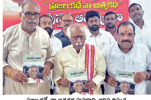
ప్రజల కోసం అత్యంత పుస్తకాన్ని అవిష్కరిస్తున్న హర్యానా మాజీ గవర్నర్ బండారు దత్తాత్రేయ

దశాబ్దాల క్రితం రెండు పౌర వివాహాలను కూల్చివేసిన ఘటనకు సంబంధించి ఆయన బాధ్యత వహించాలని ఆమె అంటున్నారు. ఇప్పుడు 94 ఏళ్ల వయసులో ఉన్న రోల్ క్యాస్ట్రో చర్యలు తీసుకునేందుకు వాషింగ్టన్ సిద్ధమవుతుండటంతో క్యూబాలో తీవ్ర ఆందోళన నెలకొంది. క్యూబాపై కూడా ఇంధన సరఫరాపై ఒత్తిడి పెరిగింది. విద్యుత్ కోతలు, ఆహార కొరత, ఆర్థిక సంక్షోభం మరింత తీవ్రమయ్యాయి. ఈ పరిస్థితుల్లో అమెరికా విదేశాంగ మంత్రి మార్కో రుబియో చేసిన తీవ్రవాద ప్రవచన దృష్టిని అమెరికా వ్యాఖ్యలు ప్రవచన దృష్టిని అమెరికా వ్యాఖ్యలు అనవచ్చు కమ్యూనిస్టుల నడుపుతున్నారని, అమెరికా తీరాలకు కేటండ్ 90 మైళ్ల దూరంలో విఫలమైన దేశం ఉండటం తమ జాతీయ భద్రతకు ముప్పు. ఆయన వ్యాఖ్యానించారు. ఆ వ్యాఖ్యలను అభ్యర్థకరంగా సంపూర్ణ వ్యక్తి అలీనా ఫెర్నాండెజ్. క్యూబా