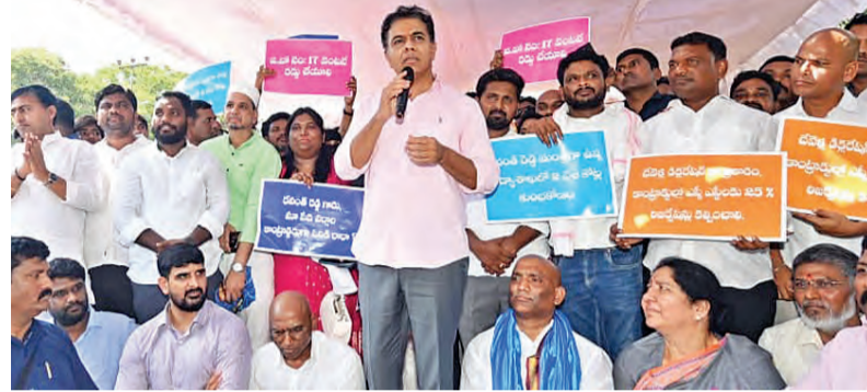
ధర్మాచారి, మే 30 ప్రభాతవార్త: బిస్మిల్ మైసూరికి కాంట్రాక్టు లిజెన్డేషన్లు ఇస్తామని దగా చేసిన కాంగ్రెస్

పంచకుల, మే 30: దేశంలోనే అత్యంత ప్రతిష్టాత్మక రక్షణ రంగ సంస్థ డిఆర్డీవో (డిఫెన్స్ రీసెర్చ్ అండ్ డెవలప్ మెంట్ అగ్రిజేషన్) సంస్థ మరో భారీ బాంబు పరీక్షకు సిద్ధమైంది. హర్యానాలోని పంచకుల జిల్లాలోని టెర్రిన్ లో బాల్టిస్ట్ రిసెర్చ్ ల్యాబ్లో (బీఆర్ఎల్) అనే ల్యాబ్ పరిధిలో ఈ ప్రయోగం జరగనుంది. ఇది బాంబులు, ఆయుధాలు తయారు చేసే పరిశోధన ప్రత్యేక కేంద్రం. ఇక్కడ ఆదివారం ఒక అడుగుతీసి, భారీ బాంబుల డీఆర్డీవో ప్రజాప్రచారా బాంబు ప్రయోగం సమయంలో ఇంధనం బయటకు రావద్దని సూచించింది. ముందు జాగ్రత్త చర్యగా ఈ ల్యాబ్ ను సమీప గ్రామంలోని ప్రజలంతా ఇంధనం ఉంచడాని సూచించింది. ప్రయోగం జరిగే సమయంలో బయట ఉండకపోవడమే మంచిదిగా సూచించింది. ఇదే సమయంలో ఈ బాంబు ప్రయోగం గురించి అతిగా ఆందోళన చెందాల్సిన అవసరం కూడా లేదని చెప్పింది. ఇది సాధారణ పరీక్షల్లో భాగమే అని, ప్రజలు భయంభంగం గురించి కావల్సిన పని లేదని సూచించింది. దీనిపై జరిగే దుర్ఘటనలను నివారించే కుడా సుస్థం చేసింది. డిఆర్డీవో జారీ చేసే జాగ్రత్త చర్యలు పాటిస్తే మేలని చెప్పింది. ఇప్పుడు వెబ్సైట్ యేదీ భారీ బాంబు పరీక్ష. పేలుడు తర్వాత దీని ప్రభావం గాలిలో 1.5 కిలోమీటర్ల వరకు ఉంటుందని, దీనిని వెబ్సైట్ జోన్ లో పిలుస్తారని వెల్లడించింది. ప్రజల సంరక్షణార్థం ఇక్కడికి స్థానికులను గురించుకున్న అనుమతిపడం లేదన్నారు. పూర్తి జాగ్రత్తలు, ప్రాజెక్ట్ లో పనిచేసే నిర్వాహక సిబ్బందిని గురించి ఇంధనం ఎయిర్ ఫోర్స్ కూడా పరిశీలించి పర్యవేక్షించనుంది.